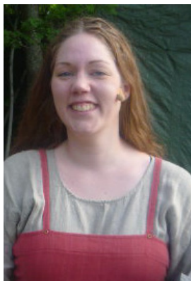
s.6 Arnljotgänget i Stiklestad. Andreas Ekeroots foto

Jag har sett föreställningen tidigare, och det är kanske det som gör att jag förstår hela handlingen och förstår de flesta av