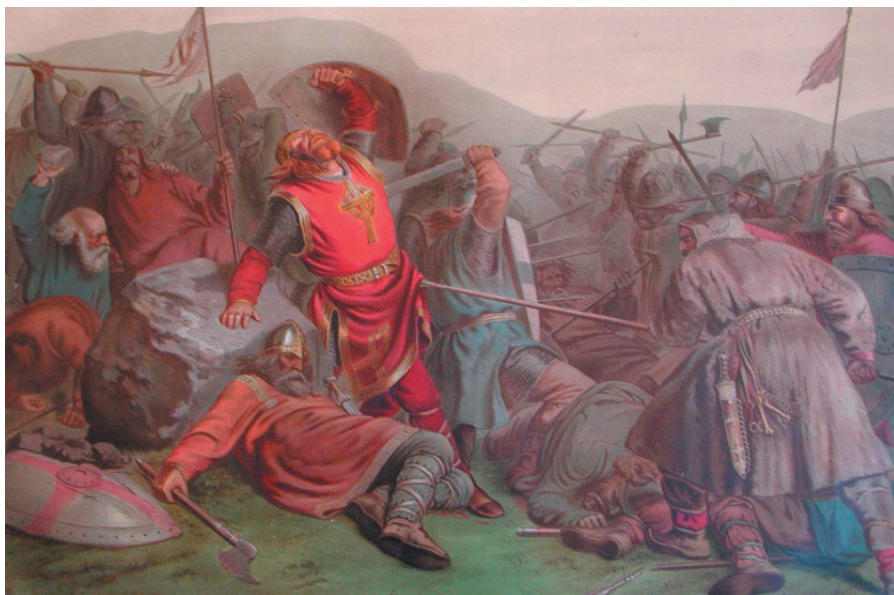
Peter Nicolai Arbo (1831-1892): "Olav den Helliges død" (1859)