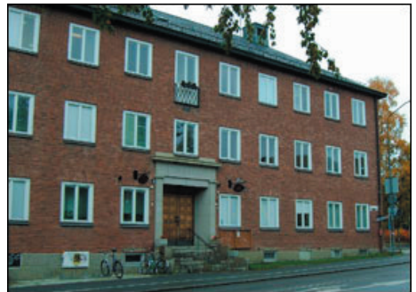
G:la Tingshuset, sept. 2005.